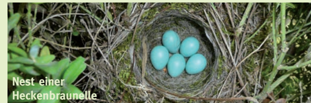
Nest einer Heckenbraunelle

❁ ● Wenn es kalt wird... September bis Dezember ...treffen Eichhörnchen u.v.a. Tiere Vorbereitungen für den Winter. Sie sammeln Vorräte und suchen sich geeignete Verstecke. Wir wollen auch Winterquartiere bauen. Ob sie wohl vor Kälte schützen?